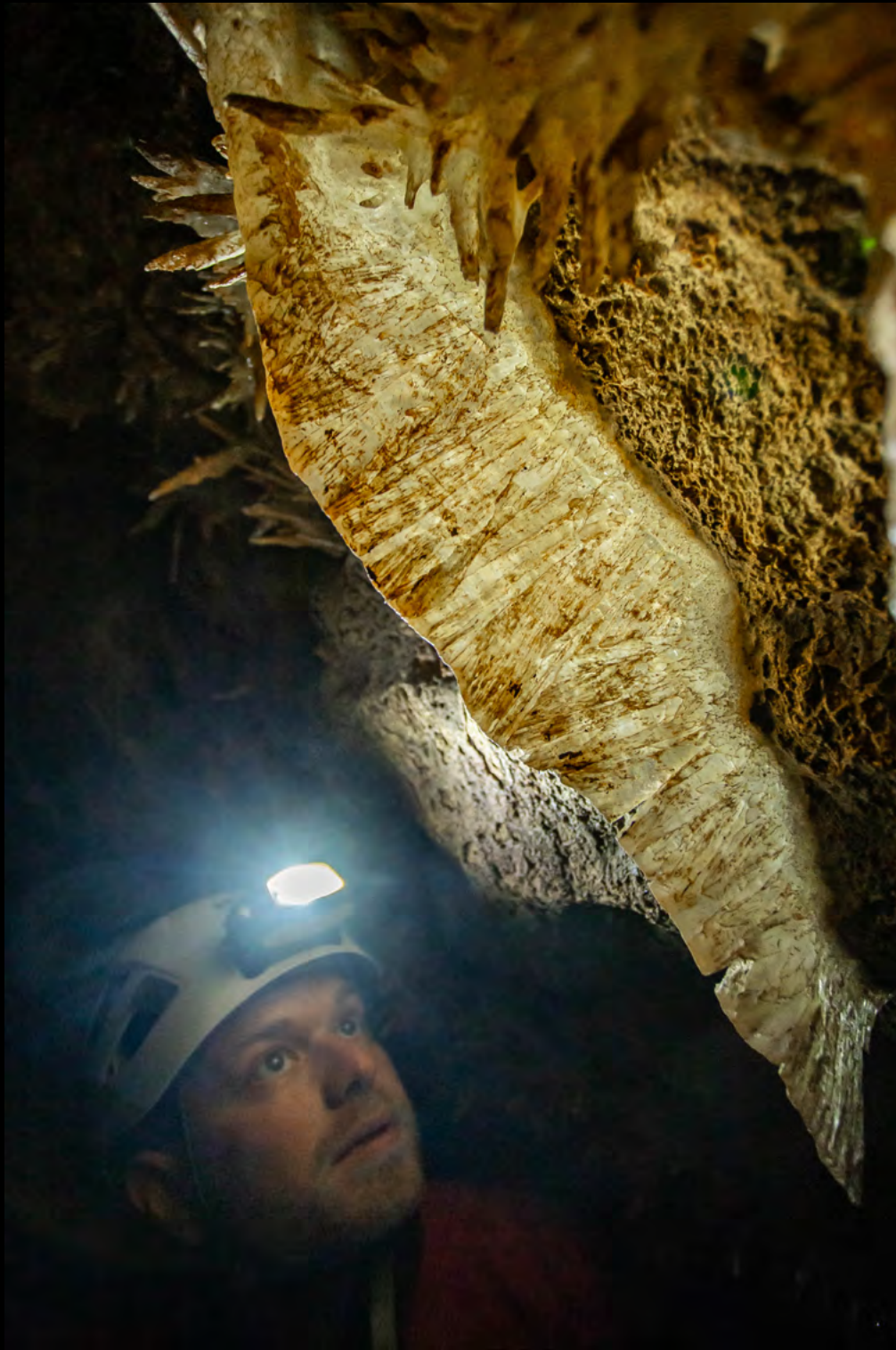
Ivan Šulek Cave's fin