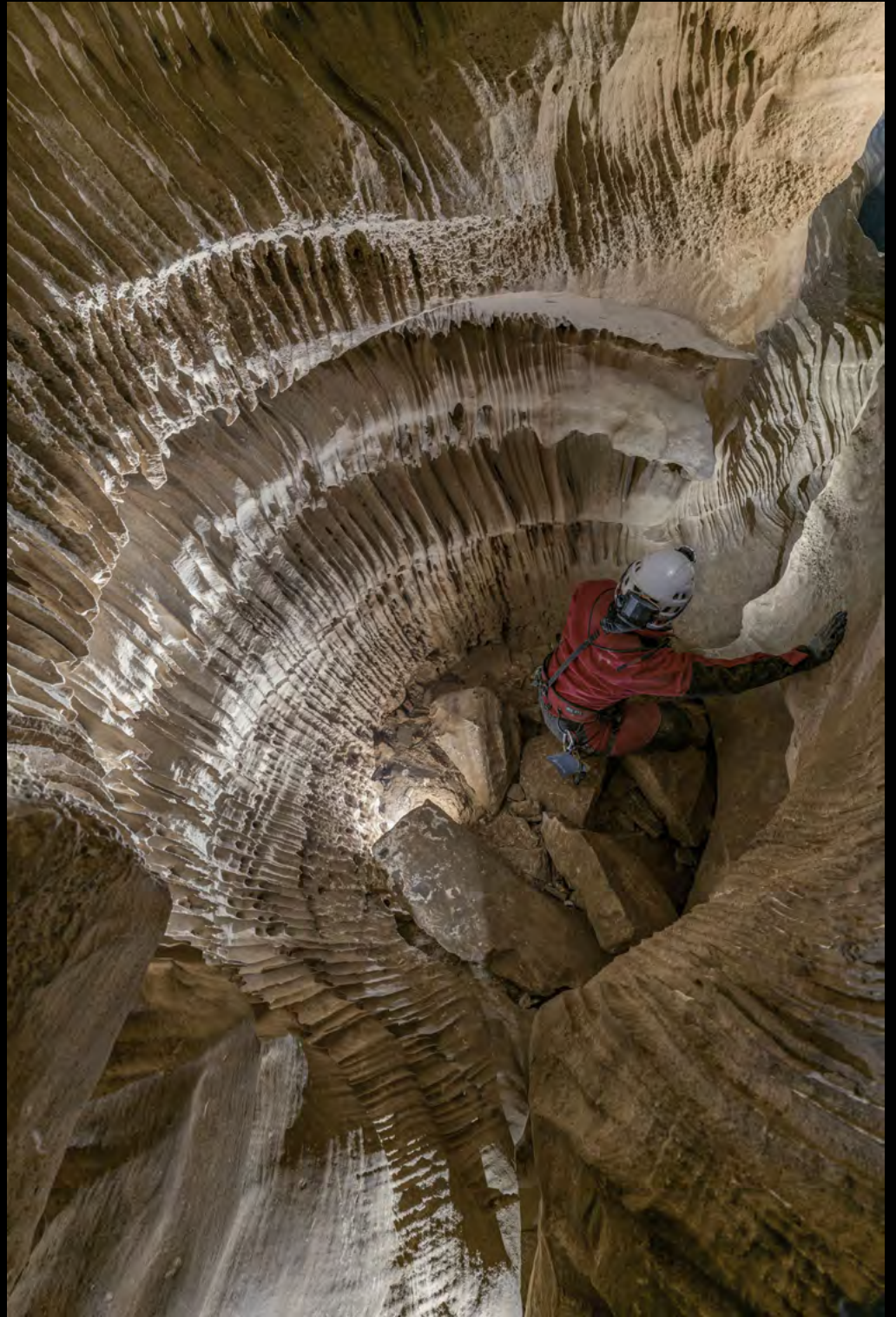
Luca Castellani Following water