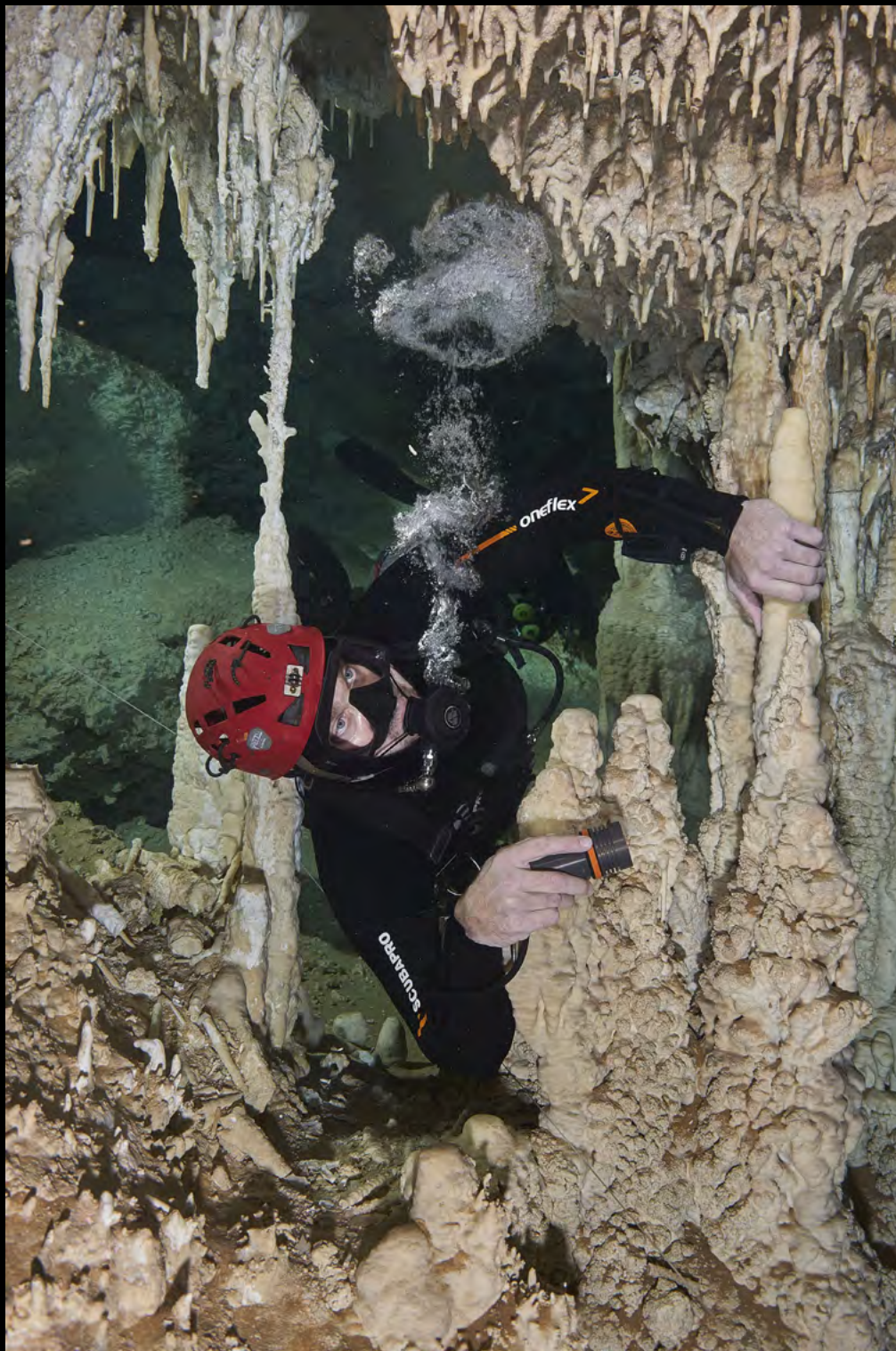
Karol Kyška Mexiko systema Tatich bubles