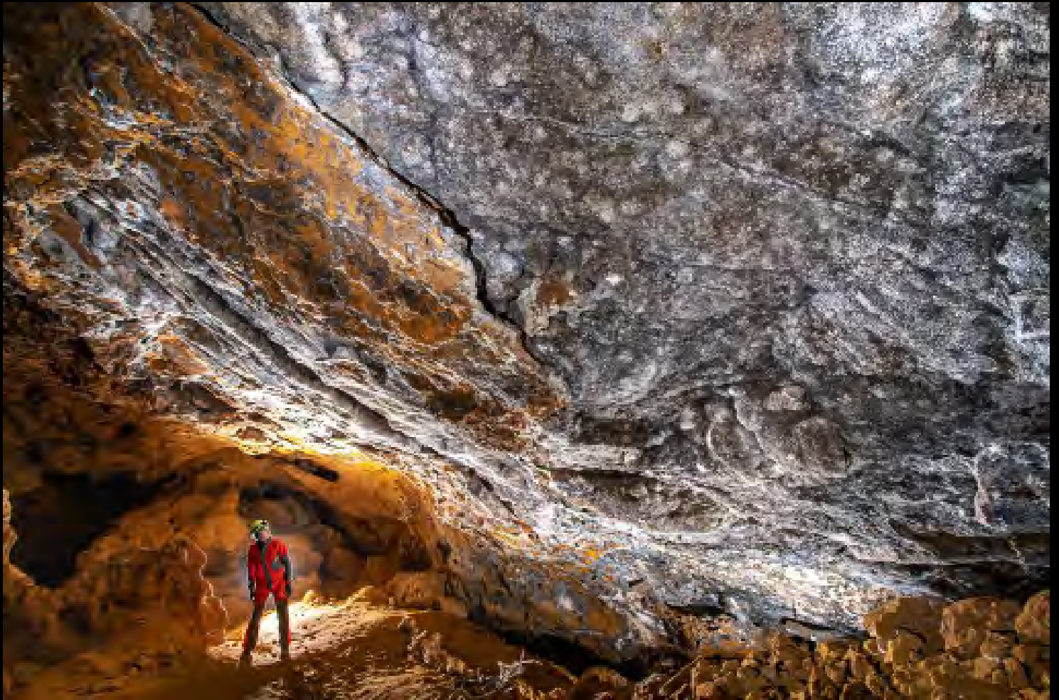
Juan Pérez Iron oxide