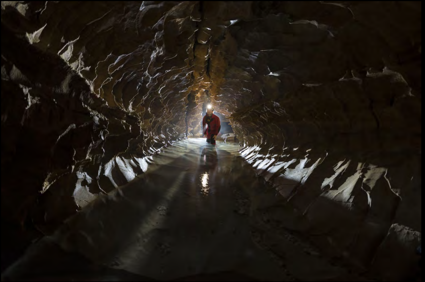
Andrea Adalberto The Belly of the Whale