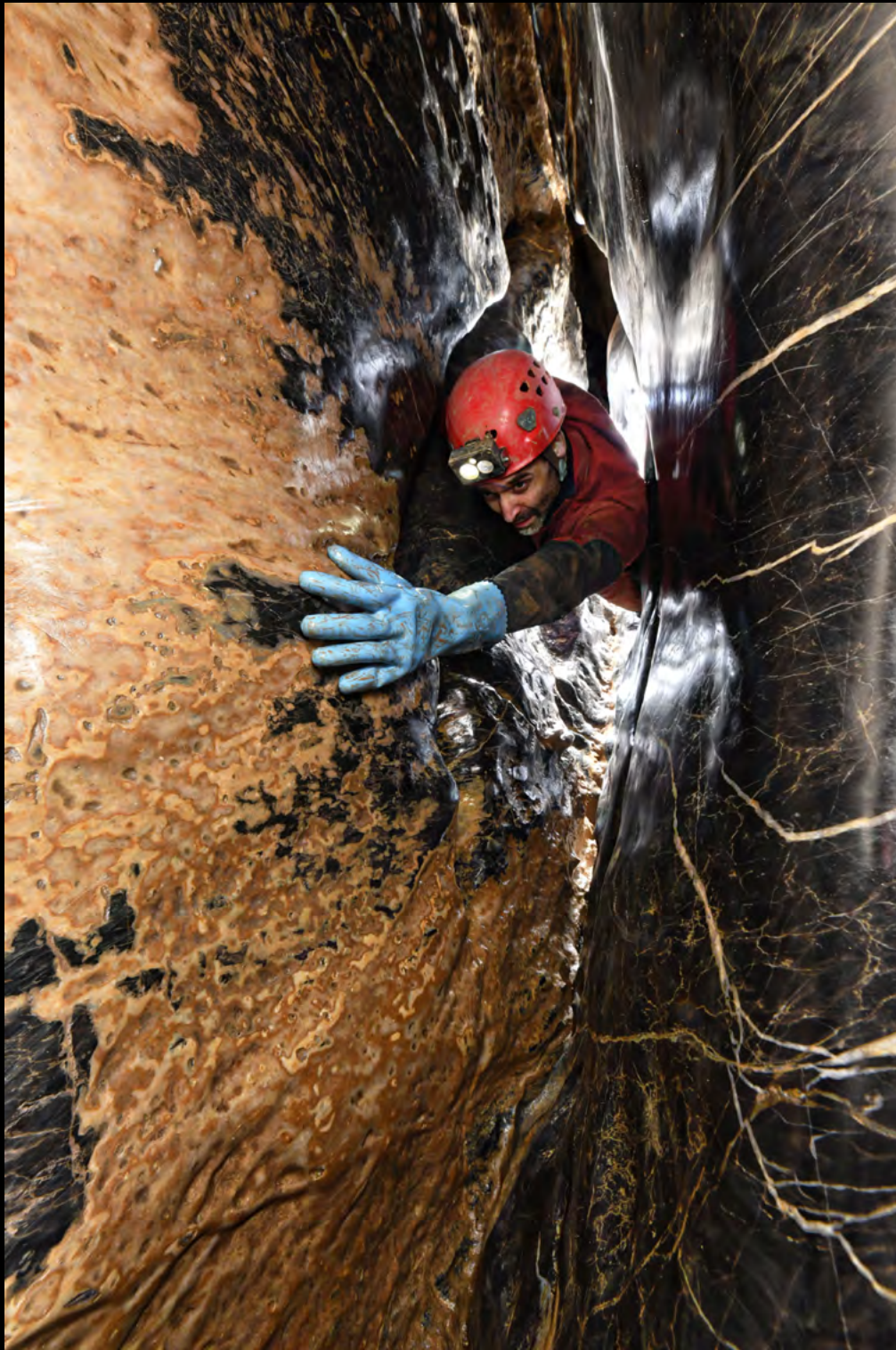
Gaëtan Rochez Letterbox