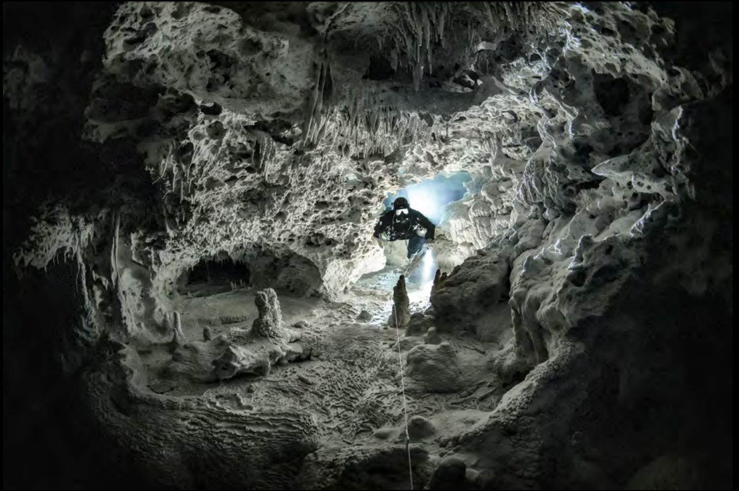
Martin Broen Passage