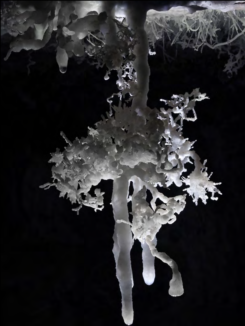
Cosmin Berghean Aragonite