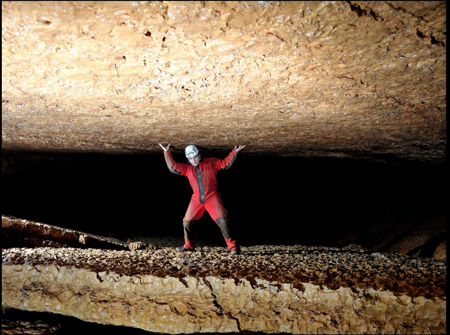
Ovidiu Guja Sisif