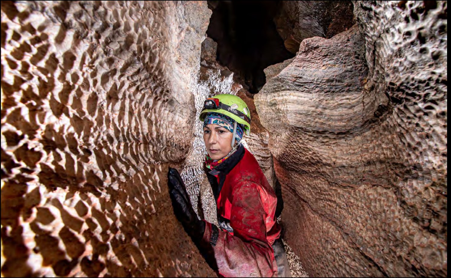
Juan Pérez Gypsum sump