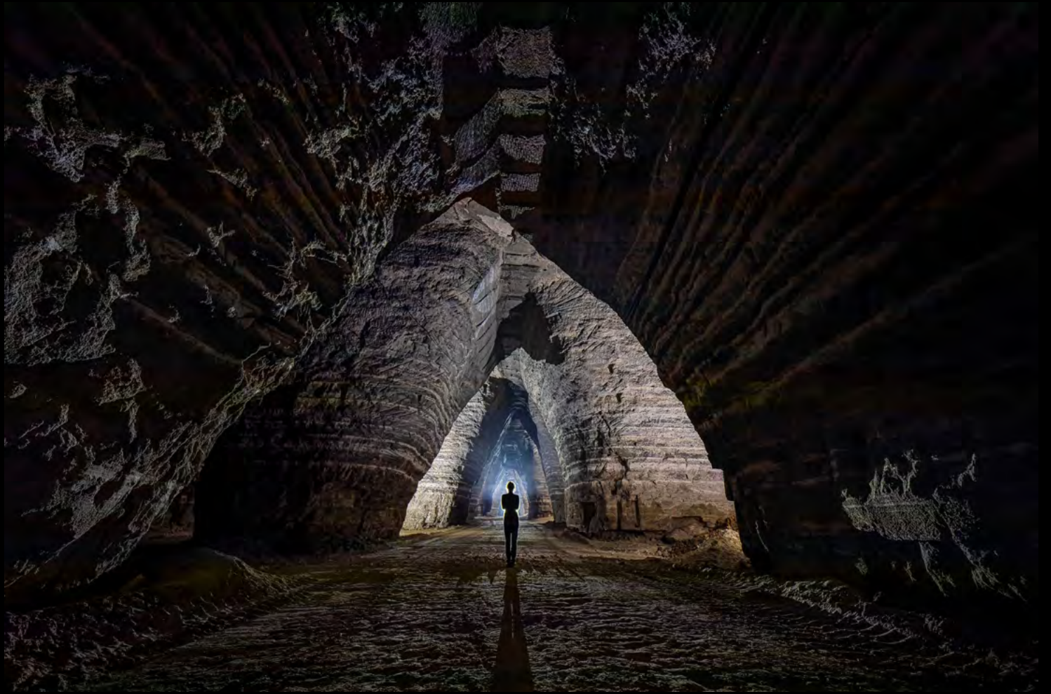
Tristan Fricker Cathedral