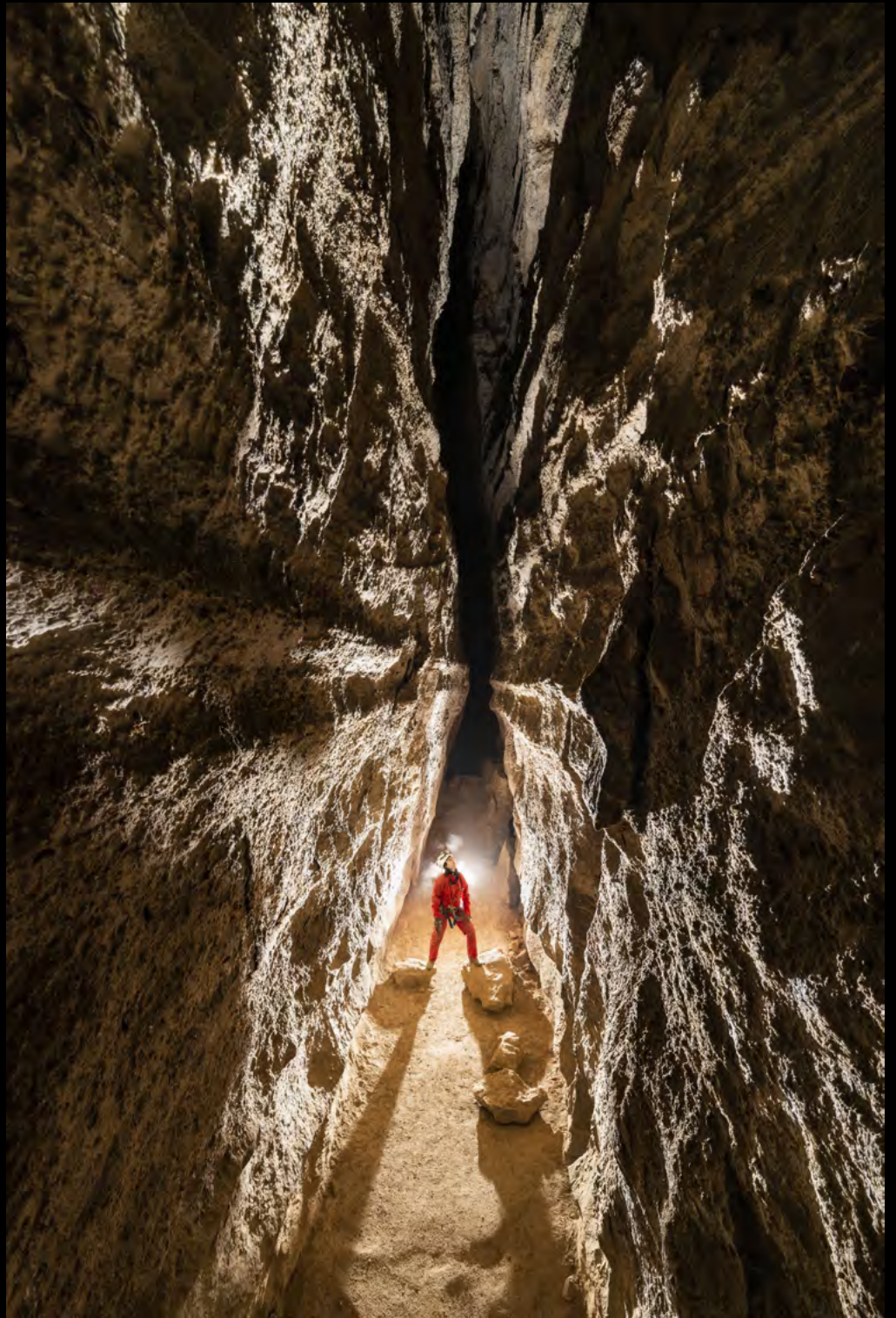
Leo Poiret Diaclase Duret