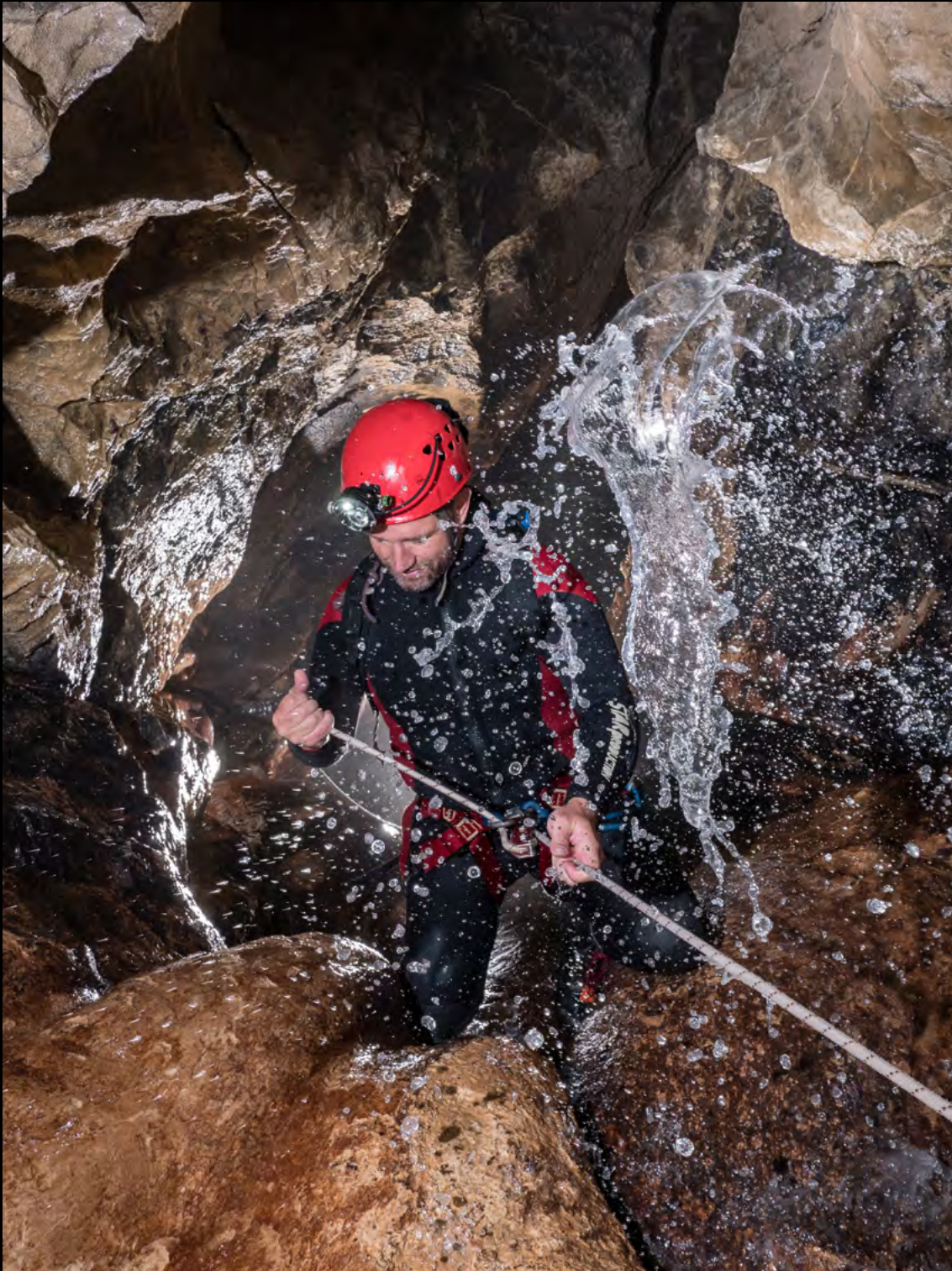
Maestracci Brice Waterfall