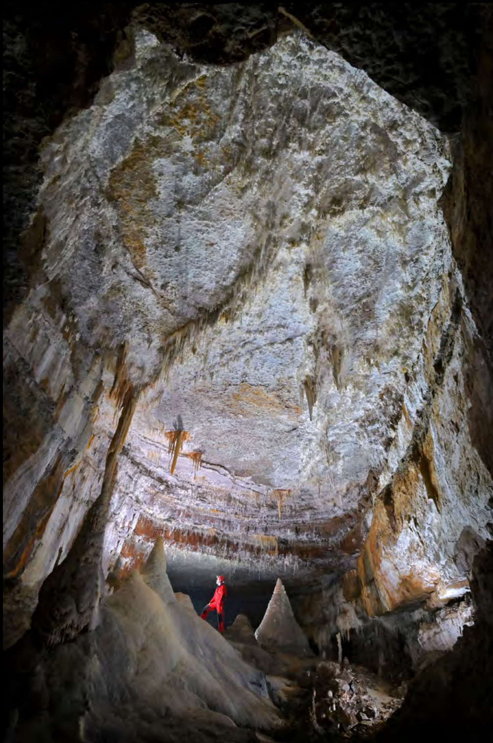
Cosmin Berghean Puech des Bondons