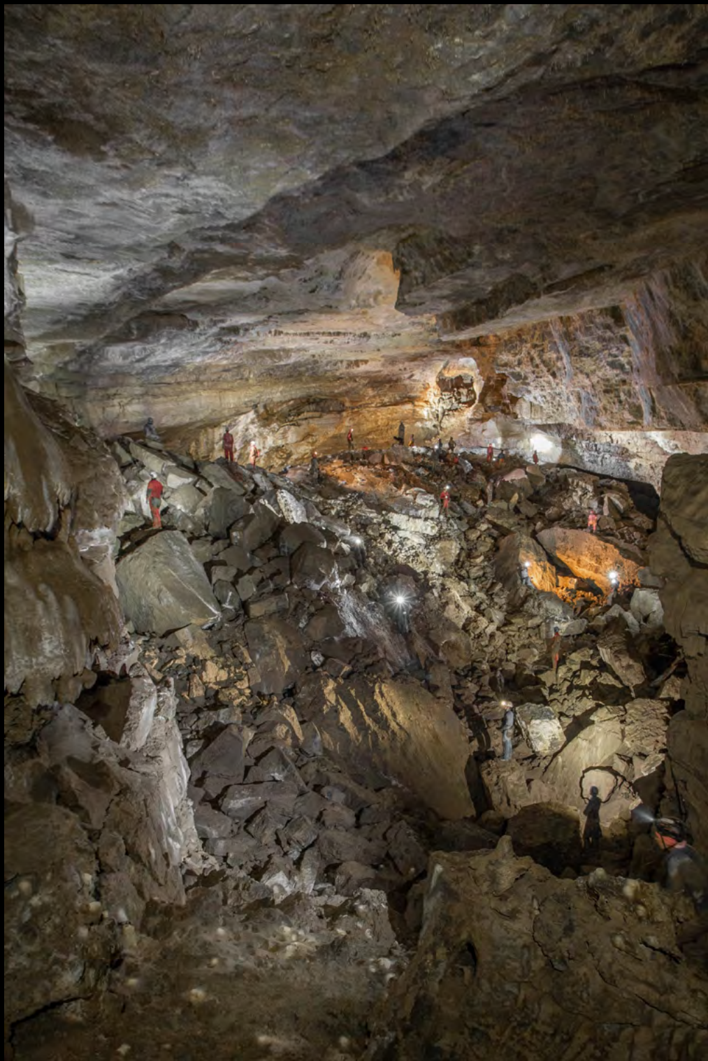
Ivan Šulek Over crowded