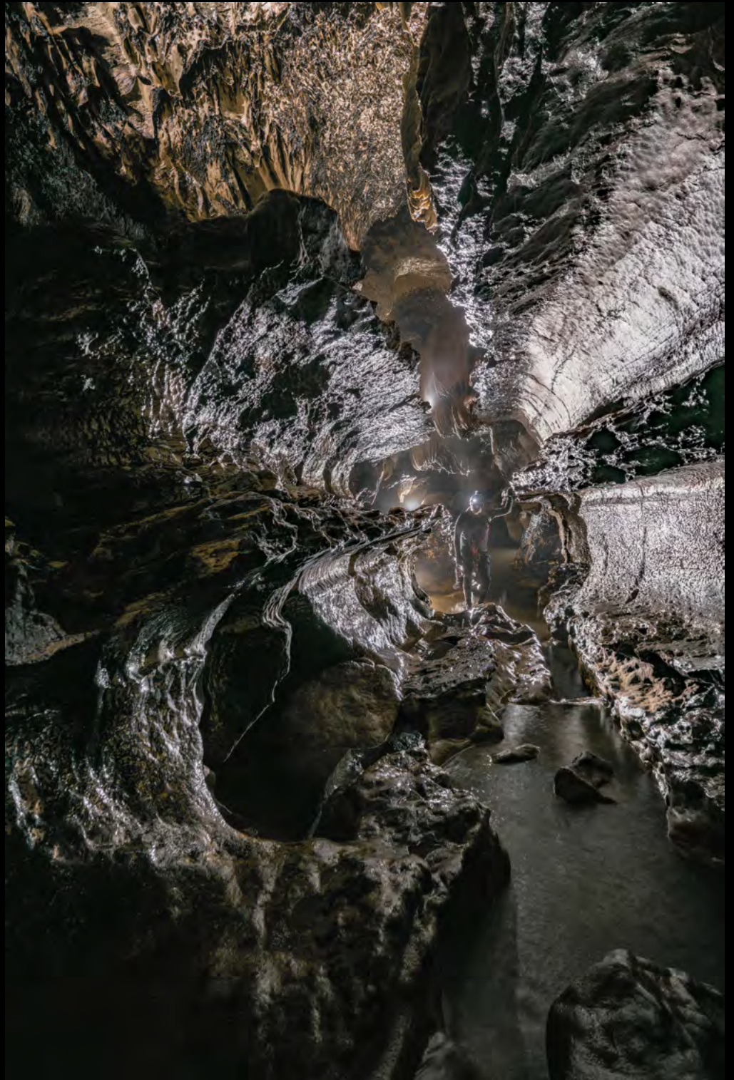
Valeria Miele Perspective reflections