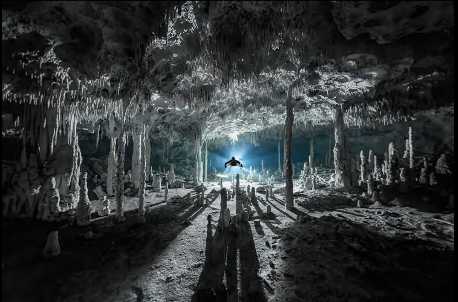
Martin Broen Columns