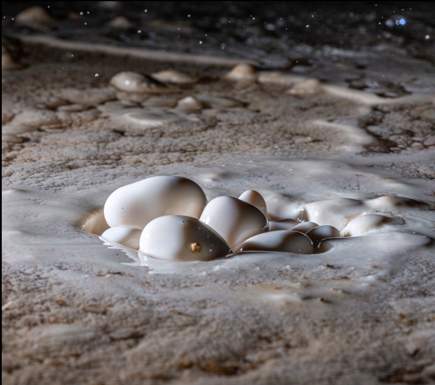
Sebastien Colson Pearl