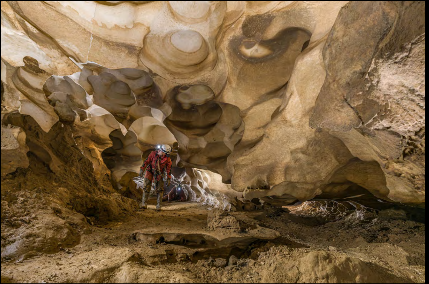
Luca Castellani Hypogenic heart