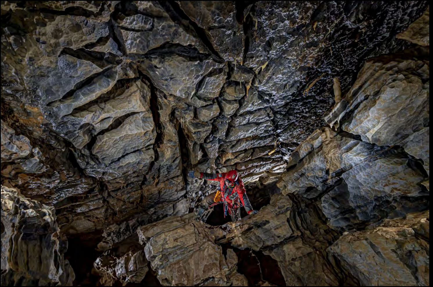
Juan Montero Cracked roof