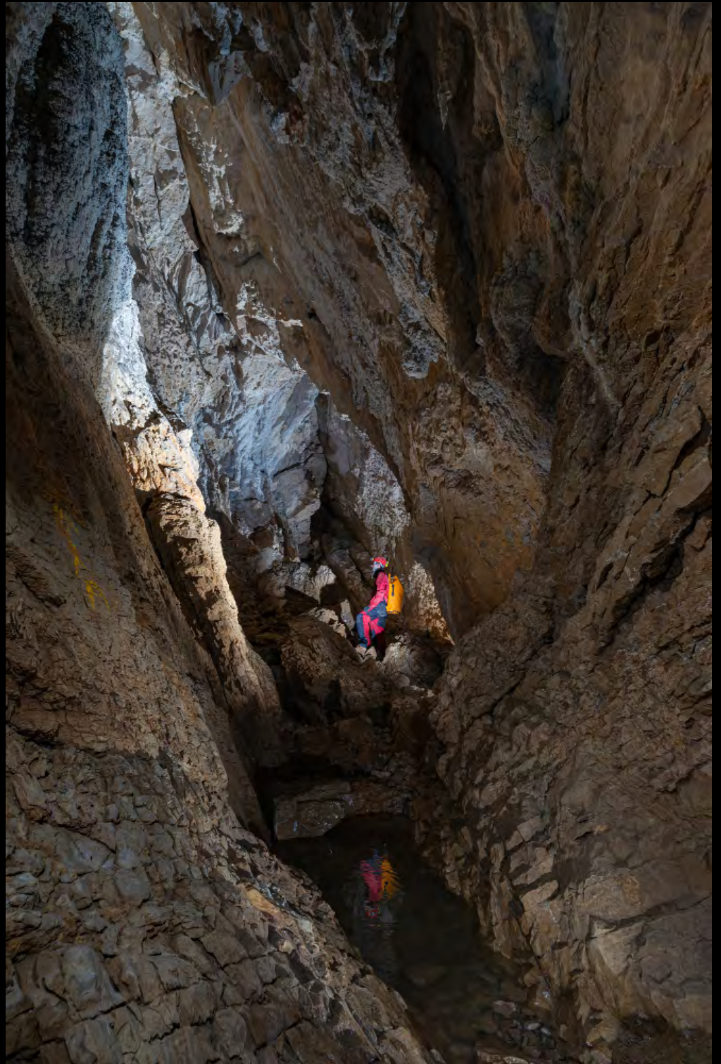
Sebastien Colson Galery