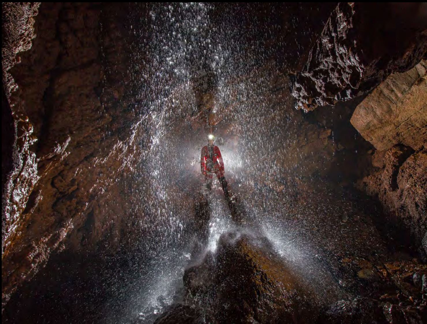
Juan Pérez Waterfall