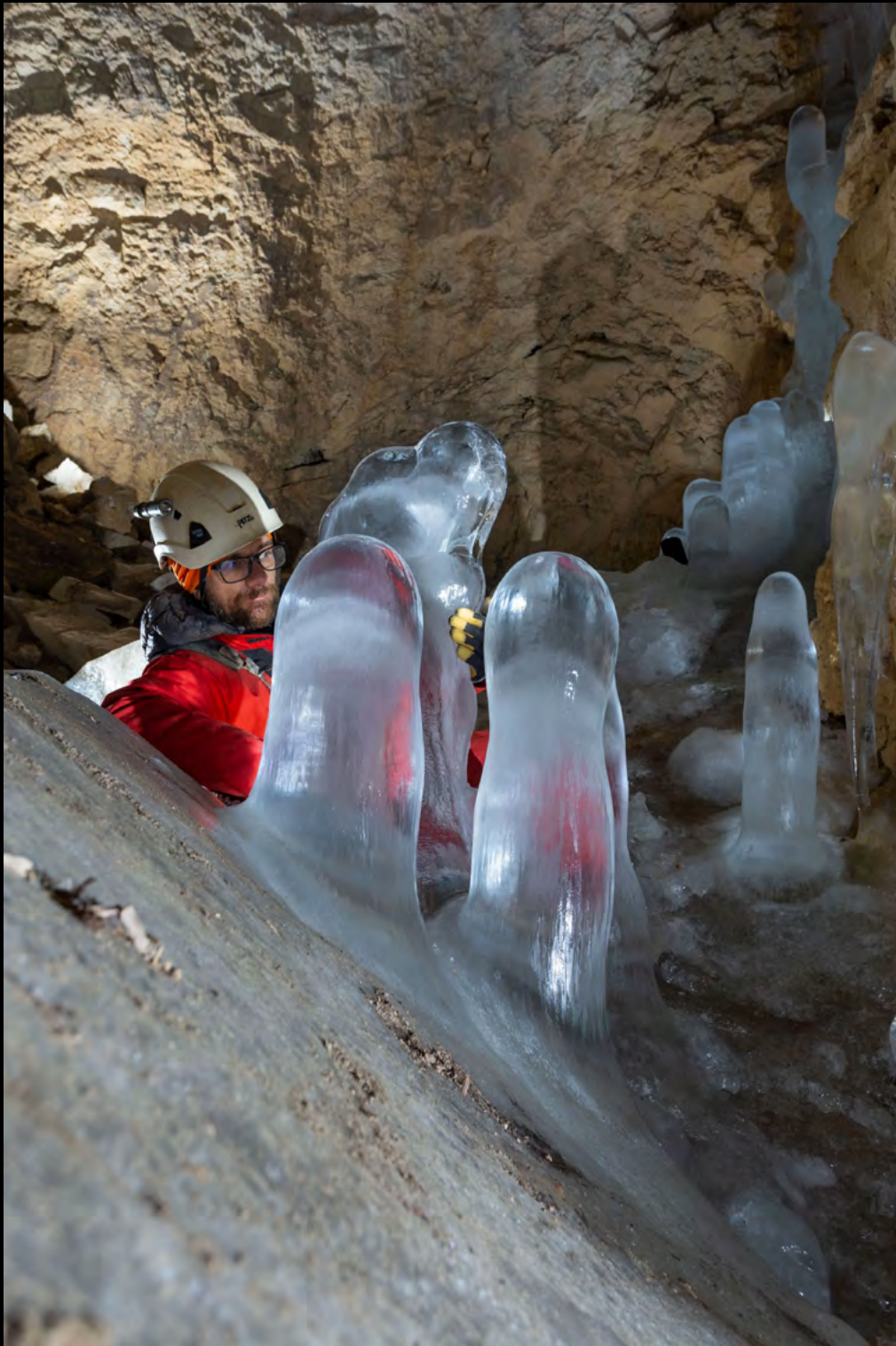
Daniele Sighel Transparencies