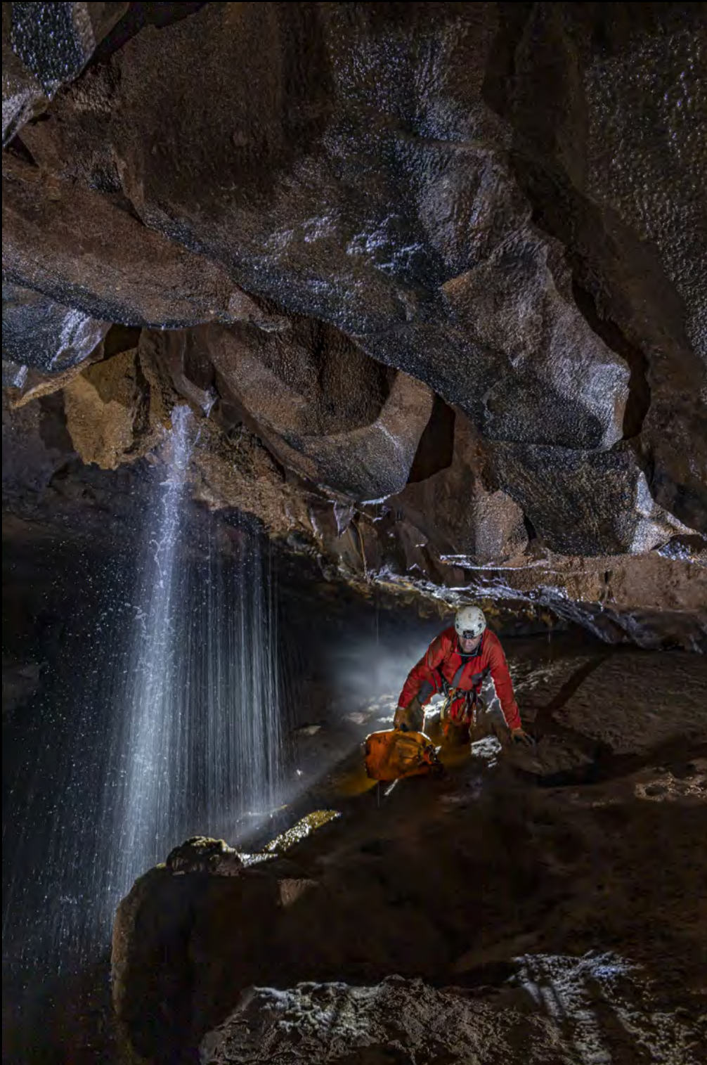
Juan Montero Under storm