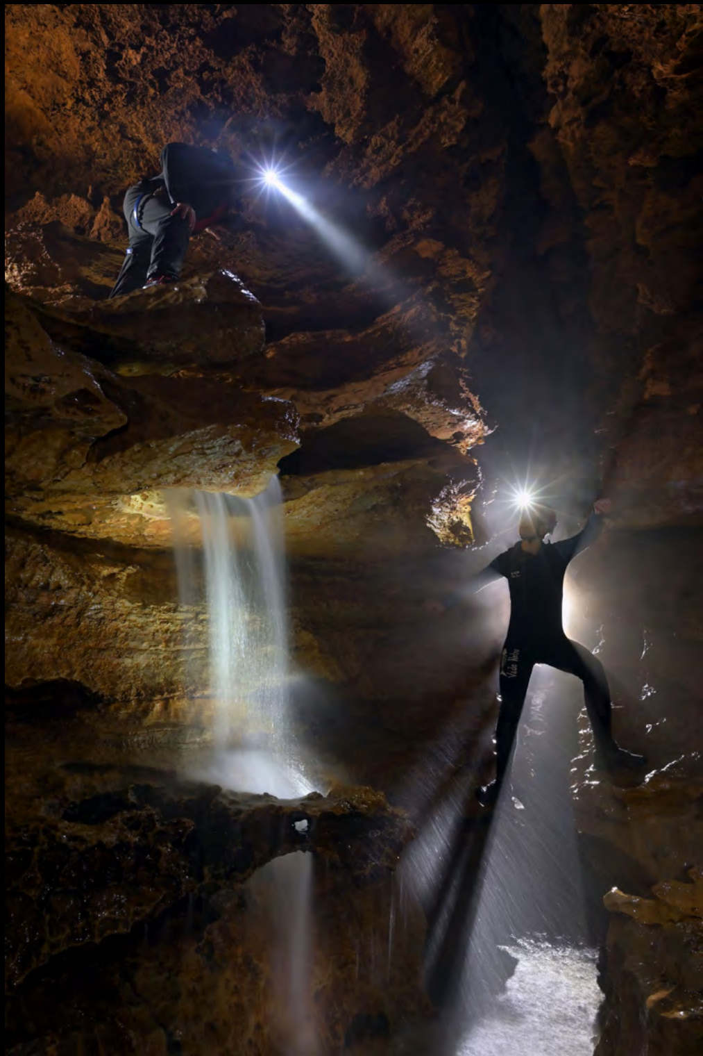
Cosmin Berghean Where are you