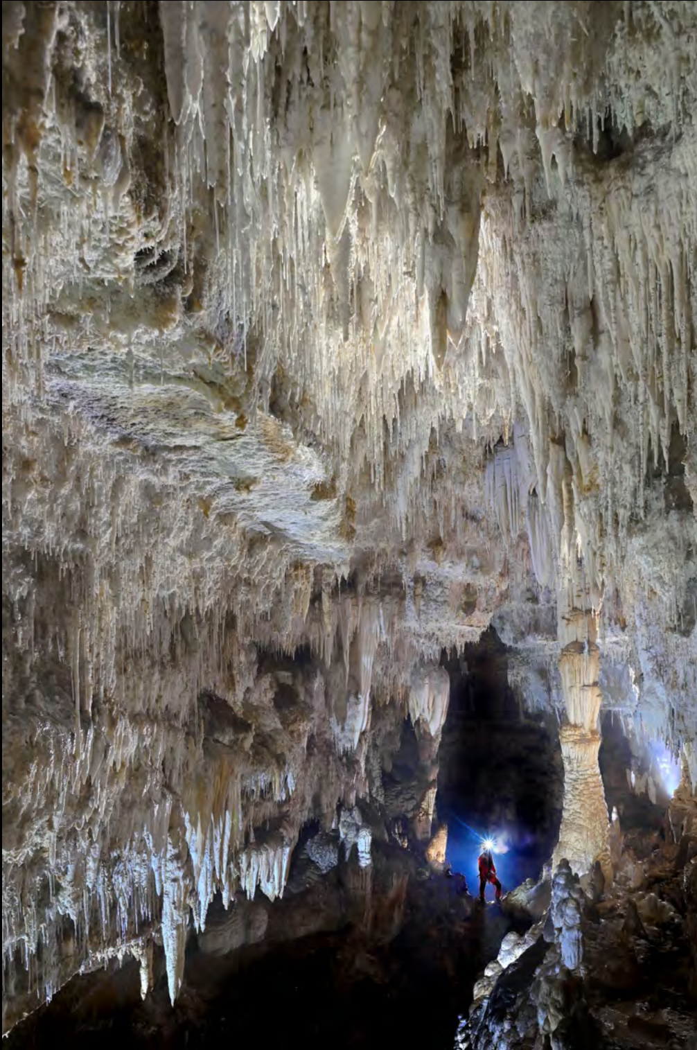
Cosmin Berghean Hidden worlds